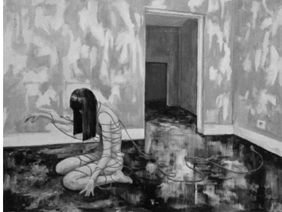
Gambar 1. "Disconnected" ( Isa, 2025).

Selain itu, temuan ini sejalan dengan pandangan Han & Jeffrey (2017) bahwa keterputusan emosional dapat menjadi bentuk regulasi emosi yang mengarahkan individu pada pemaknaan ulang pengalaman batin. Secara keseluruhan, penelitian ini menunjukkan bahwa seni lukis berfungsi sebagai medium transformatif yang mengintegrasikan jarak emosional, dinamika kesadaran, dan upaya pembebasan diri. Dikarenakan penelitian ini bukan eksperimen / bukan wawancara, tapi kajian pustaka konseptual dan analisis karya seni, maka data hasil yang kita ambil adalah analisis dari konsep dan analisis karya seni lukis, berikut karya yang kami ambil.