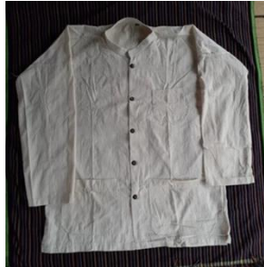
Gambar 1. Baju Kampret dan Tenun Putih Baduy Dalam, analisis semiotika visual tenun Baduy sebagai identitas desain etnik kontemporer (Tristiawan, 2025)