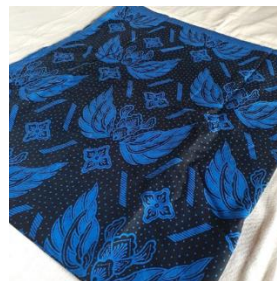
Gambar 2. Kain Ikat Kepala (Lomar) atau Tenun Baduy Luar, analisis semiotika visual tenun Baduy sebagai identitas desain etnik kontemporer (Tristiawan, 2025).

Temuan makna visual di atas menunjukkan bahwa tenun Baduy memiliki potensi kuat untuk diadaptasi menjadi identitas desain etnik kontemporer. Mengacu pada teori Stuart Hall (Dewi, et al., 2024), identitas adalah production yang tidak pernah selesai; maka, membawa visual Baduy ke ranah kontemporer adalah bentuk pelestarian yang dinamis. Relevansi tersebut dapat dilihat dari tiga aspek utama: