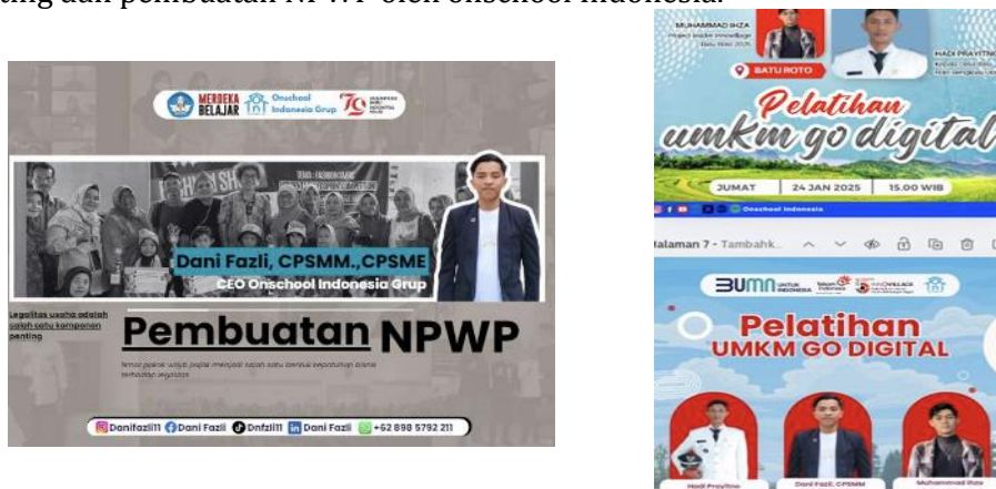
Gambar 4. Pelatihan Digital Marketing dan Pembuatan NPWP oleh Onschool Indonesia

Materi pelatihan disusun dalam bentuk modul yang mudah dipahami, meliputi digital marketing, pembuatan NPWP/NIB, legalitas usaha (sertifikasi halal, PIRT), dan literasi keuangan. Adapun salah satu contoh materi yang diajarkan yakni tentang pembuatan NPWP. Selain itu Penggunaan alat desain seperti Canva untuk menghasilkan materi visual yang menarik dan mendidik. Hal ini terlihat dari gambar 4 pelatihan digital marketing dan pembuatan NPWP oleh onschool Indonesia.