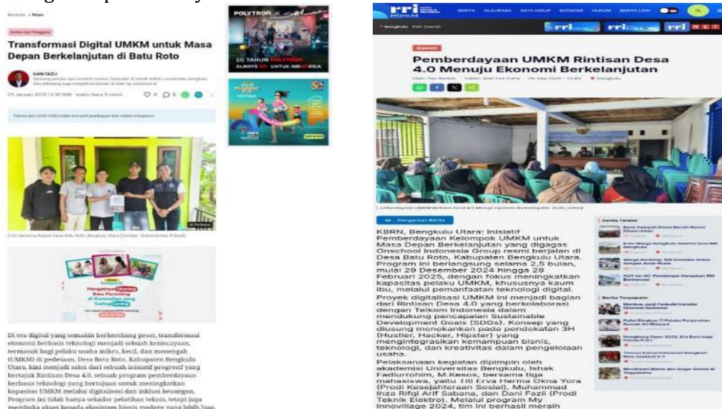
Gambar 6. Dampak Kegiatan Pemberdayaan UMKM

Proyek "Rintisan Desa 4.0: Pemberdayaan Kelompok UMKM untuk Masa Depan Berkelanjutan" telah membawa dampak sosial yang nyata dan menyeluruh, dengan penerapan inovasi yang merambah ke berbagai lapisan masyarakat (Lidia & Suharyanti, 2023). Berikut penjelasan detail mengenai dampak sosial yang dirasakan pada gambar 6 dampak kegiatan pemberdayaan UMKM :