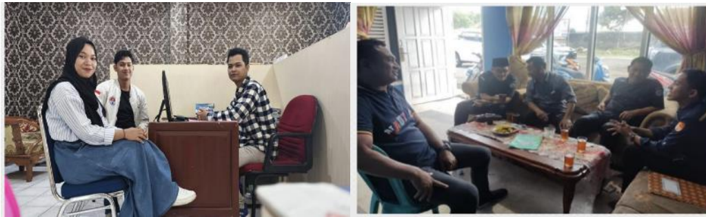
Gambar 1. Persiapan Tim Pelaksana Kegiatan dan Koordinasi Pelaksanaan Kegiatan dengan Pemerintah Desa Batu Roto