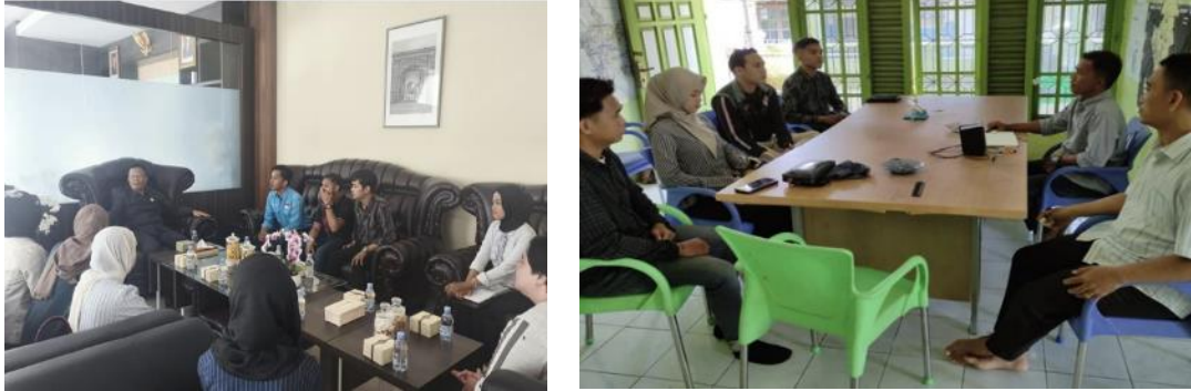
Gambar 2. Dialog Bersama Stake Holder dan Pembagian Tugas

Zuryani et al., 2025). Seperti ditunjukkan gambar 2 dialog bersama stake holder dan pembagian tugas.