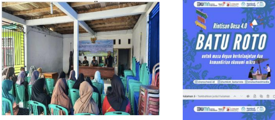
Gambar 5. Peluncuran Program dan Pelaksanaan Kegiatan Rintisan Desa 4.0 Desa Batu Roto

Ditunjukkan gambar 5 peluncuran program dan pelaksanaan kegiatan rintisan desa 4.0 Desa Batu Roto.