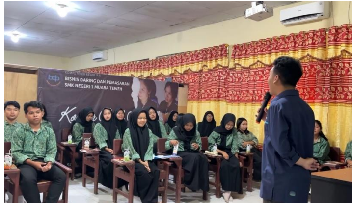
Gambar 2. Potret pemaparan materi mindset

Gambar 2. menunjukkan dokumentasi saat penyampaian materi Mindset: Fixed vs Growth . Dalam konteks siswa SMK masa kini, pemahaman mengenai growth mindset sangat relevan. Mereka berada pada fase persiapan menuju dunia kerja, dimana perkembangan industri menuntut kesiapan mental, kemampuan beradaptasi, hingga keterampilan untuk belajar hal-hal baru dengan cepat. (Abbas Zakaria et al., 2025) mengatakan bahwa siswa SMK dengan growth mindset akan lebih terbuka terhadap perubahan, lebih tahan terhadap tekanan, serta mampu mengembangkan kreativitas dan inovasi yang dibutuhkan di era persaingan global yang semakin ketat. Hal ini sejalan dengan temuan (Ahmad Saiful Rizal, 2023) yang menyebutkan bahwa penerapan growth mindset pada siswa dapat meningkatkan motivasi intrinsik, kedisiplinan belajar serta kepercayaan diri dalam menghadapi tantangan akademik maupun perubahan di era digital yang semakin canggih.