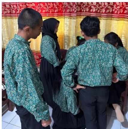
Gambar 5. Potret siswa sedang brainstorming pada studi kasus

Pada Gambar 5. menunjukkan sejumlah siswa sedang melakukan proses diskusi. Adapun hasil diskusi dari 30 siswa yang dibagi menjadi 5 kelompok menunjukkan bahwa mayoritas peserta menilai pelaku sebaiknya segera melakukan klarifikasi dan meminta maaf secara publik dengan mengunggah video klarifikasi di TikTok agar permasalahan tidak semakin meluas. Tapi, penulis menilai bahwa klarifikasi secara daring tidak selalu diperlukan, terutama dalam kasus ini dimana tidak disebutkan secara spesifik dokumen apa yang terekam dalam unggahan tersebut. Penyelesaian internal justru lebih tepat dilakukan, misalnya dengan segera menghapus konten yang bermasalah, meminta maaf secara langsung kepada pihak perusahaan, serta menunjukkan sikap bertanggung jawab dengan tidak mengulangi kesalahan yang sama. Hal ini sekaligus menjadi pelajaran bagi siswa bahwa etika bermedia sosial memiliki kaitan erat dengan profesionalisme kerja. Bersikap profesional tidak selalu identik dengan melakukan klarifikasi di ruang publik, tetapi lebih pada bagaimana seseorang mampu menunjukkan tanggung jawab, belajar dari kesalahan, dan menjaga kepercayaan yang telah diberikan oleh institusi tempat ia bekerja. Adapun dokumentasi kegiatan presentasi hasil brainstorming yang dilakukan oleh siswa tertera pada Gambar 6. Berikut.