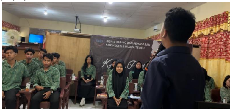
Gambar 7. Potret penyampaian materi Personal Branding

Penulis memberikan contoh nyata dari dua orang teman yang berhasil memanfaatkan media sosial sebagai sarana personal branding hingga mendapatkan pekerjaan yang baik. Selain pemanfaatan media sosial, penulis juga menjelaskan mengenai dokumen-dokumen penting yang dibutuhkan dalam aplikasi pekerjaan. Salah satunya adalah surat pengantar atau cover letter , peserta juga diperkenalkan dengan berbagai format Curriculum Vitae (CV), mulai dari CV berbasis Applicant Tracking System (ATS) yang banyak digunakan dalam proses rekrutmen perusahaan, hingga CV kreatif yang lebih cocok untuk melamar pekerjaan di bidang kreatif. Tak hanya itu, siswa juga dikenalkan cara menyusun dan mengunggah portfolio pada media sosial profesional seperti LinkedIn agar karya dan pengalaman mereka lebih mudah diakses oleh calon pemberi kerja. Ditunjukkan oleh Gambar 7. mengenai suasana pemaparan materi di Ruang Laboratorium Bisnis Digital SMKN 1 Muara Teweh.