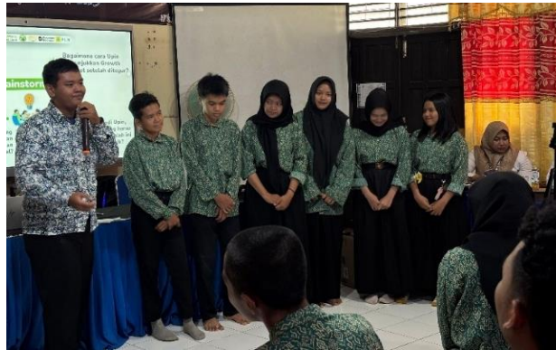
Gambar 6. Kelompok siswa mempresentasikan hasil brainstorming