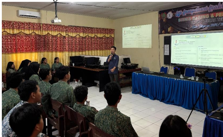
Gambar 4. Potret penyampaian materi Profesionalisme di Dunia Kerja

Pada Gambar 3. profesionalisme diperkenalkan melalui istilah K.E.R.E.N , yaitu singkatan dari K onsisten, E tika, R esponsibility (tanggung jawab), E xpertise (skill dan ilmu), serta N iat baik dan Integritas. Konsistensi bermakna bahwa seorang individu harus mampu menjaga kualitas kerja secara berkelanjutan tanpa bergantung pada situasi eksternal. Etika menekankan pentingnya perilaku yang sopan, santun dan menghargai norma yang berlaku, termasuk etika dalam bermedia sosial. Siswa diajak memahami bahwa penggunaan media sosial secara bijak, seperti menghindari ujaran kebencian, penyebaran hoaks, maupun konten unggahan yang merugikan diri sendiri dan orang lain baik saat berada dalam lingkungan profesional maupun saat tidak berada di lingkungan profesional, adalah bagian dari profesionalisme di era digital.