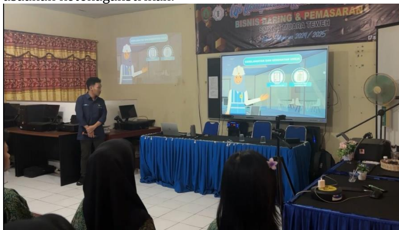
Gambar 8. Potret penyampaian materi Awareness K2/K3 dengan media video animasi

Materi terakhir dalam workshop ini yaitu mengenai Kesehatan dan Keselamatan Kerja (K3). Siswa diajak memahami bahwa penerapan K3 tidak hanya berlaku di lingkungan kerja lapangan atau area industri berat, tetapi juga di kantor maupun ruang kerja lainnya, dimana sikap disiplin, kesadaran dan budaya kerja yang aman tetap harus diterapkan. Selain K3 secara umum, peserta juga diperkenalkan dengan materi Keselamatan Ketenagalistrikan (K2) yang berkaitan langsung dengan latar belakang penulis yang sedang bekerja di perusahaan ketenagalistrikan.