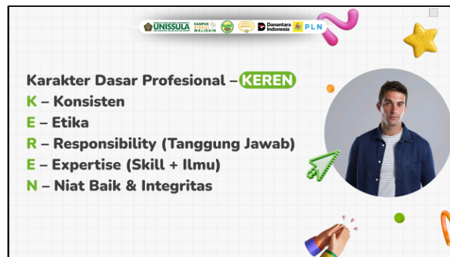
Gambar 3. Karakter dasar profesional dikenalkan dengan istilah K.E.R.E.N

Pada Gambar 3. profesionalisme diperkenalkan melalui istilah K.E.R.E.N , yaitu singkatan dari K onsisten, E tika, R esponsibility (tanggung jawab), E xpertise (skill dan ilmu), serta N iat baik dan Integritas. Konsistensi bermakna bahwa seorang individu harus mampu menjaga kualitas kerja secara berkelanjutan tanpa bergantung pada situasi eksternal. Etika menekankan pentingnya perilaku yang sopan, santun dan menghargai norma yang berlaku, termasuk etika dalam bermedia sosial. Siswa diajak memahami bahwa penggunaan media sosial secara bijak, seperti menghindari ujaran kebencian, penyebaran hoaks, maupun konten unggahan yang merugikan diri sendiri dan orang lain baik saat berada dalam lingkungan profesional maupun saat tidak berada di lingkungan profesional, adalah bagian dari profesionalisme di era digital.