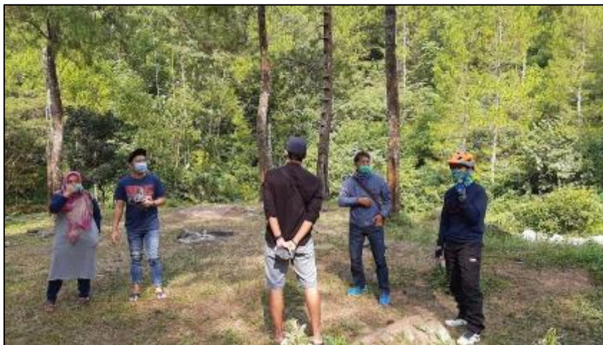
Gambar 3. Lokasi pembangunan penempatan tenda kemah

Pada kegiatan pengabdian masyarakat ini, diimplementasikan di kawasan Bumi Perkemahan Bedengan yang berfokus pada perbaikan fasilitas area perkemahan dan pelatihan. Perbaikan area penempatan tenda menjadi fokus utama dalam pengabdian ini, dimana penempatan tenda tidak hanya beralasan tanah saja namun beralasan vapping sehingga menjadi lebih ramah dan aman untuk ditempati pengunjung yang berkemah. Pemilihan tempat disepakati bersama antara ketua penelitian dengan ketua pengelola kawasan Bumi Perkemahan Bedengan dengan mempertimbangkan pembangun wahana lainnya dari ketua kegiatan lainnya pula seperti yang ditunjukkan pada Gambar 3.