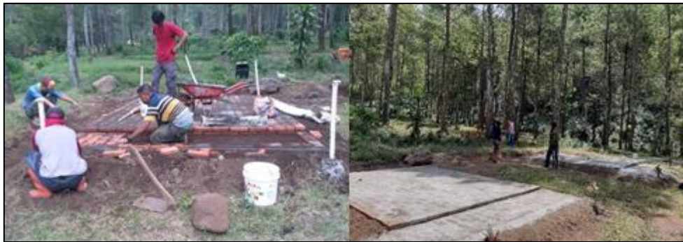
Gambar 4. Proses konstruksi pondasi area penempatan tenda (Sumber : Dokumentasi pribadi)

Pada tanggal 27 Agustus 2020, dilakukan proses pembangunan paving sebagai pondasi alas tenda perkemahan. Tim pengabdian turut serta dalam proses pembangunan ini yakni menyerahkan dan pengarahan desain yang diinginkan kepada Bapak Agus selaku pemimpin tim pembangunan paving perkemahan. Proses pertama dilakukan dengan meratakan tanah untuk membangun pondasi area pemavingan. Daerah yang divaping terdiri dari tiga unit yang masing-masing memiliki ukuran 4 x 2,5 m. Pondasi ditempatkan pada tanah yang tinggi, bertujuan agar mengurangi resiko terkenanya air yang diakibatkan oleh genangan air hujan, dengan demikian area perkemahan khususnya didalam tenda menjadi lebih bersih dan juga nyaman seperti ditunjukkan pada Gambar 4.