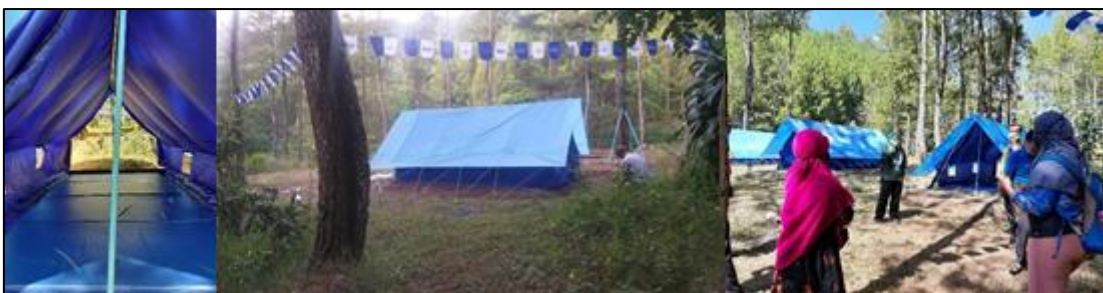
Gambar 5. Hasil pemasangan tenda perkemahan

Tempat pemasangan tenda perkemahan yang sudah jadi, selanjutnya tim pengabdian membeli dan memasang tenda yang sesuai dengan yang dirancang di proposal pengabdian. Tenda yang dipesan memiliki keunggulan dimana kain yang digunakan lebih tebal seperti yang ditunjukkan pada Gambar 5. Pemasangan tenda dilakukan pada tanggal 2 Oktober 2020. Pada kesempatan ini juga dilakukan uji coba oleh LP2M yang sekaligus menjadi tempat diadakannya monev.