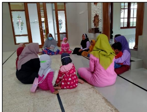
Gambar 1. Pembukaan Kegiatan Pelatihan Peningkatan Pemahaman Berbahasa Inggris pada Santri TPQ Al Kautsar 1

Tim pengabdian kepada masyarakat menentukan hari pelaksanaan kegiatan pengabdian kepada masyarakat storytelling kepada para santri TPQ Al Kautsar 1 pada hari Jumat pada tanggal 21 Februari 2020. Tim pengabdian kepada masyarakat dan 2 mahasiswa pengajar storytelling datang ke lokasi pengabdian kepada masyarakat di TPQ Al Kautsar 1 di Masjid At Taqwa yang beralamat Ngares, Kadireso, Teras, Boyolali untuk melakukan kegiatan pengabdian kepada masyarakat storytelling kepada para santri TPQ Al Kautsar 1 untuk meningkatkan kemampuan berbahasa Inggris. Peserta pelatihan kegiatan pengabdian kepada masyarakat storytelling kepada para santri TPQ Al Kautsar 1 adalah 10 santri TPQ Al Kautsar 1 yang mengikuti kegiatan pengabdian kepada masyarakat. Kegiatan pengabdian kepada masyarakat storytelling kepada para santri TPQ Al Kautsar 1 dibagi menjadi 2 kelompok, sehingga satu pelatih storytelling agar lebih fokus dalam memberikan pengajaran kepada santri TPQ Al Kautsar 1. Tiap-tiap kelompok dapat menentukan teks bacaan para Nabi yang berbahasa Inggris untuk dibacakan kepada santri TPQ Al Kautsar 1. Selama dalam kegiatan pengabdian kepada masyarakat storytelling kepada para santri TPQ Al Kautsar 1, pelatih bisa memberikan pelajaran kepada santri TPQ Al Kautsar 1 dengan pelafalan kosakata Bahasa Inggris yang benar, menunjukkan ekspresi wajah dalam bercerita, dan memperagakan yang sesuai isi ceritanya.