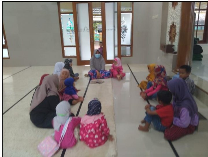
Gambar 3. Penutupan Kegiatan Pelatihan Peningkatan Pemahaman Berbahasa Inggris pada Santri TPQ Al Kautsar 1