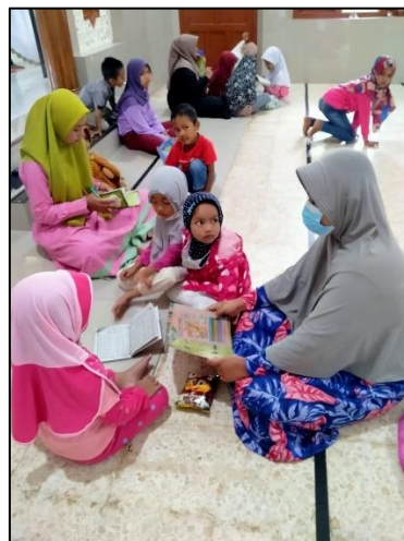
Gambar 2. Proses Kegiatan Pelatihan Peningkatan Pemahaman Berbahasa Inggris pada Santri TPQ Al Kautsar 1