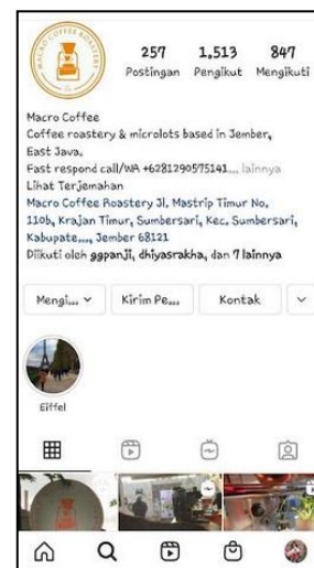
Gambar 8. Tampilan Instagram

Kegiatan promosi melalui media sosial ditambah dengan penjualan secara online melalui e-commerce dirasa manajemen semakin meningkatkan volume penjualan. Di tengah kondisi perekonomian masa pandemi yang mengalami penurunan menyebabkan konsumsi masyarakat atas kopi juga mengalami penurunan. Omzet penjualan usaha mengalami penurunan sangat signifikan diangka 40%. Dampak penurunan ini mau tidak mau membuat manajemen mencari solusi bagaimana caranya tetap bertahan. Produksi kopi juga ikut berkurang seiring dengan menurunnya permintaan kopi. Manajemen menerapkan strategi penjualan melalui pemasaran secara digital untuk mendorong naiknya volume penjualan. Aplikasi Tokopedia dan Shopee digunakan oleh manajemen untuk menjual produk kopi.