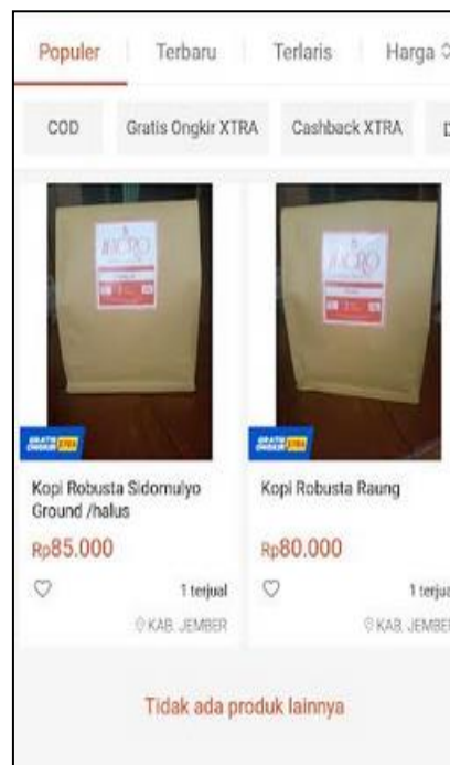
Gambar 10. Tampilan Shopee

Dengan digunakannya media sosial untuk pemasaran kopi diharapkan dapat meningkatkan penjualan produk kopi Macro Coffee Roastery .