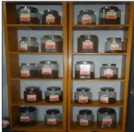
Gambar 6. Tempat menyimpan biji kopi matang

Tahapan proses produksi dilalui guna memperoleh produk kopi yang berkualitas. Selanjutnya dalam kegiatan penjualan, Macro Coffee Roastery menggunakan media sosial antara lain Instagram dan Facebook untuk mempromosikan produk kopi. Whatsapp juga aktif dioptimalkan untuk menerima pesanan dan merespons para konsumen yang bertanya tentang produk kopi. Berikut tampilan dari media sosial Facebook dan Instagram Macro Coffee Roastery .