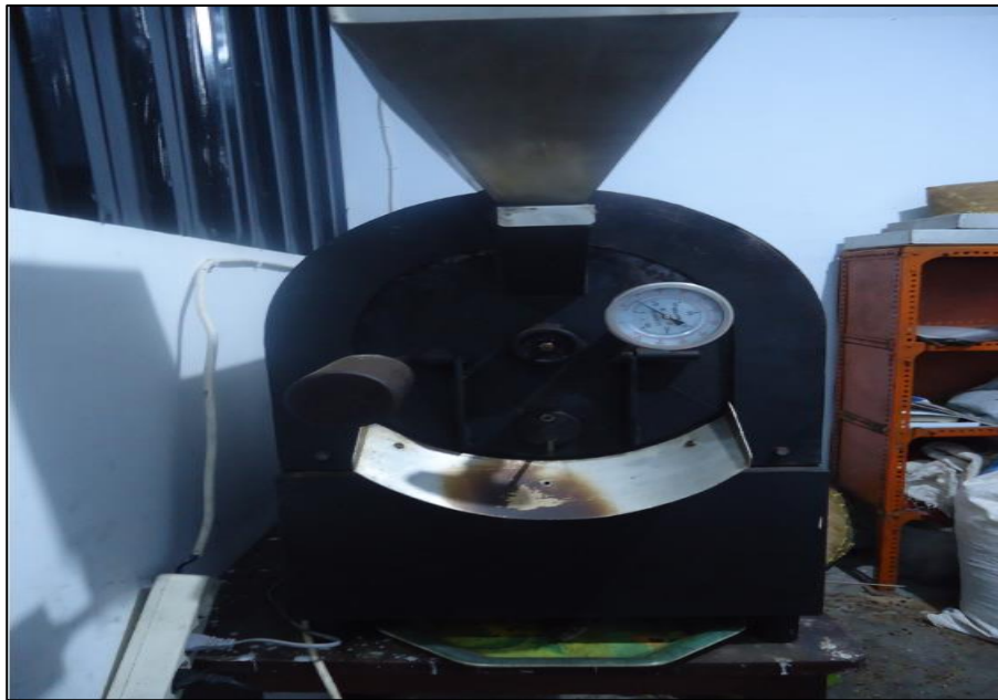
Gambar 4. Mesin sangrai

Mesin sangrai merupakan hasil karya rancangan pemilik yang mampu melayani permintaan sangrai dari kedai-kedai kopi di Jember. Dengan adanya mesin sangrai buatan sendiri ini, kualitas kopi olahan tidak kalah dengan kopi lainnya (Arizona, 2016). Macro Coffee Roastery juga menyediakan kopi kemasan yang ditawarkan dalam bentuk biji kopi dan bubuk. Biji kopi matang dan kopi bubuk diletakkan pada tempat yang tutup rapat untuk menjaga kualitas produk. Untuk kopi bubuk dikemas menjadi beberapa ukuran mulai 100gr, 250gr, 500gr dan 1000gr. Berikut contoh kemasan produk kopi bubuk yang akan dijual.