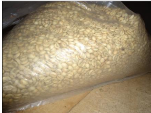
Gambar 2. Bahan baku biji kopi mentah

Usaha pengolahan kopi ini memiliki tempat penyimpanan bahan baku dan tempat produksi sendiri. Bahan baku berupa biji kopi mentah diperoleh dari para petani kopi khususnya petani lokal di Kabupaten Jember. Biji kopi mentah khas daerah lain didatangkan langsung dari tempat asalnya. Gudang tempat penyimpanan biji kopi diatur suhunya sedemikian rupa agar bahan baku tidak mengalami kerusakan. Alat-alat untuk produksi kopi mentah menjadi kopi matang dan biji kopi didesain sendiri oleh pemilik. Berikut disajikan gambarnya.