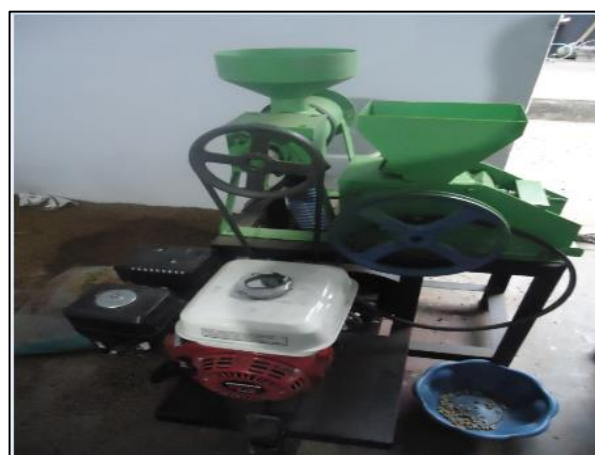
Gambar 3. Alat pemisah biji kopi dan kulit