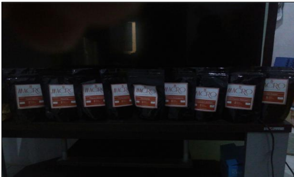
Gambar 5. Kopi bubuk

Mesin sangrai merupakan hasil karya rancangan pemilik yang mampu melayani permintaan sangrai dari kedai-kedai kopi di Jember. Dengan adanya mesin sangrai buatan sendiri ini, kualitas kopi olahan tidak kalah dengan kopi lainnya (Arizona, 2016). Macro Coffee Roastery juga menyediakan kopi kemasan yang ditawarkan dalam bentuk biji kopi dan bubuk. Biji kopi matang dan kopi bubuk diletakkan pada tempat yang tutup rapat untuk menjaga kualitas produk. Untuk kopi bubuk dikemas menjadi beberapa ukuran mulai 100gr, 250gr, 500gr dan 1000gr. Berikut contoh kemasan produk kopi bubuk yang akan dijual.