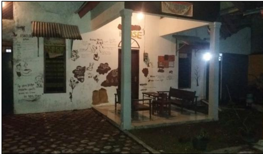
Gambar 1. Macro Coffee Roastery

Lokasi usaha yang dekat dari pusat kota dan dekat pusat pendidikan serta banyaknya permintaan kopi membuat usaha ini terus mengalami perkembangan yang signifikan. Usaha kopi ini dirintis oleh pemilik di sebuah tempat dengan konsep rumah kopi, dimana didalamnya kita bisa melihat proses pengolahan kopi dan ada tempat warung kopi untuk menjual produk kopinya. Adapun tempat usaha Macro Coffee Roastery disajikan pada gambar berikut.