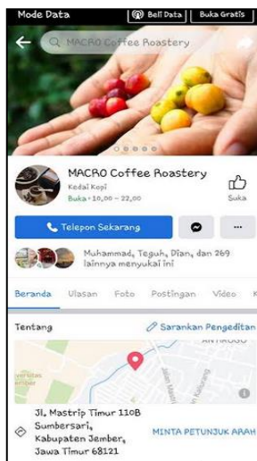
Gambar 7. Tampilan Facebook

Tahapan proses produksi dilalui guna memperoleh produk kopi yang berkualitas. Selanjutnya dalam kegiatan penjualan, Macro Coffee Roastery menggunakan media sosial antara lain Instagram dan Facebook untuk mempromosikan produk kopi. Whatsapp juga aktif dioptimalkan untuk menerima pesanan dan merespons para konsumen yang bertanya tentang produk kopi. Berikut tampilan dari media sosial Facebook dan Instagram Macro Coffee Roastery .